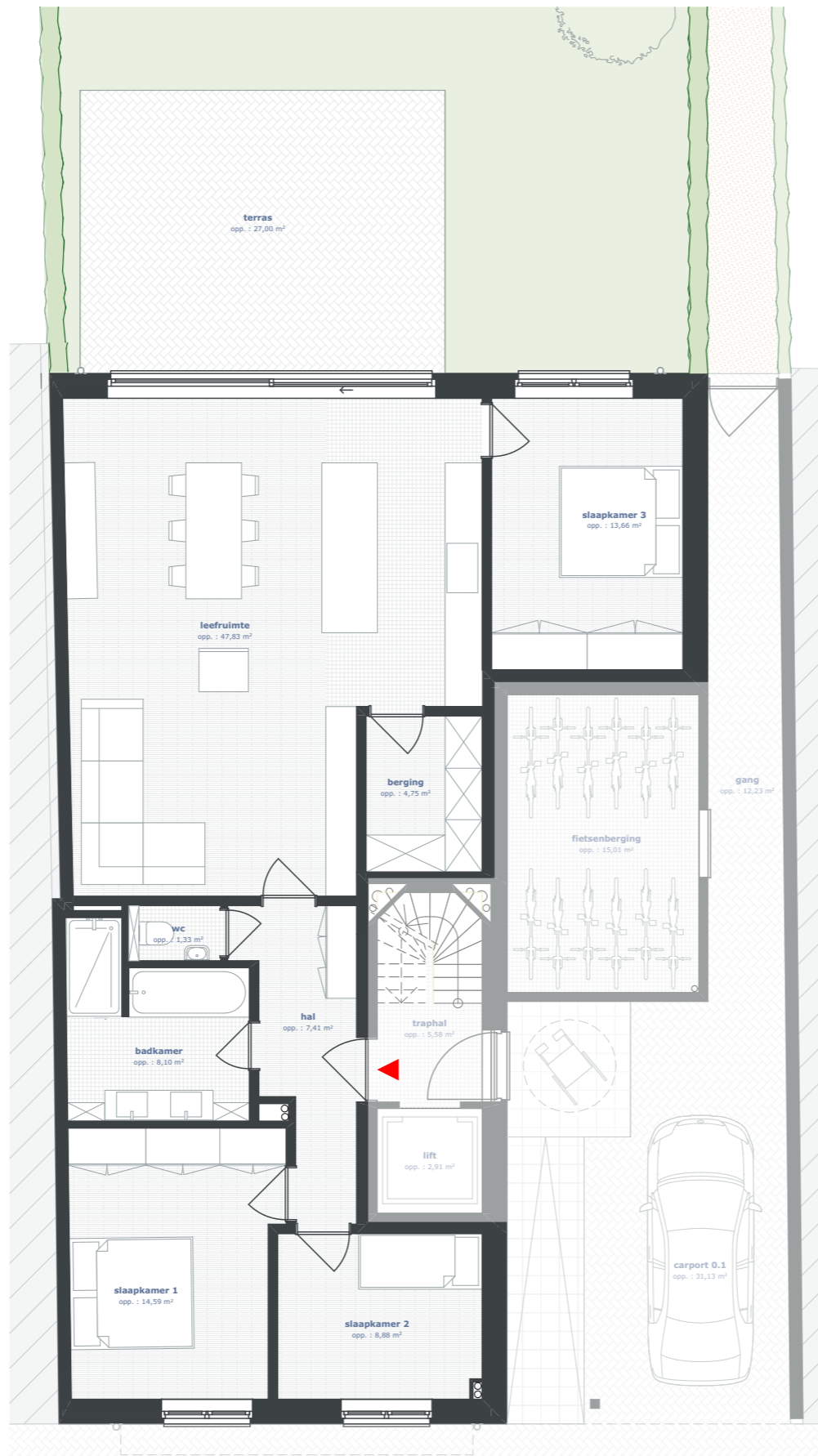
NIVO +0 - 1:100