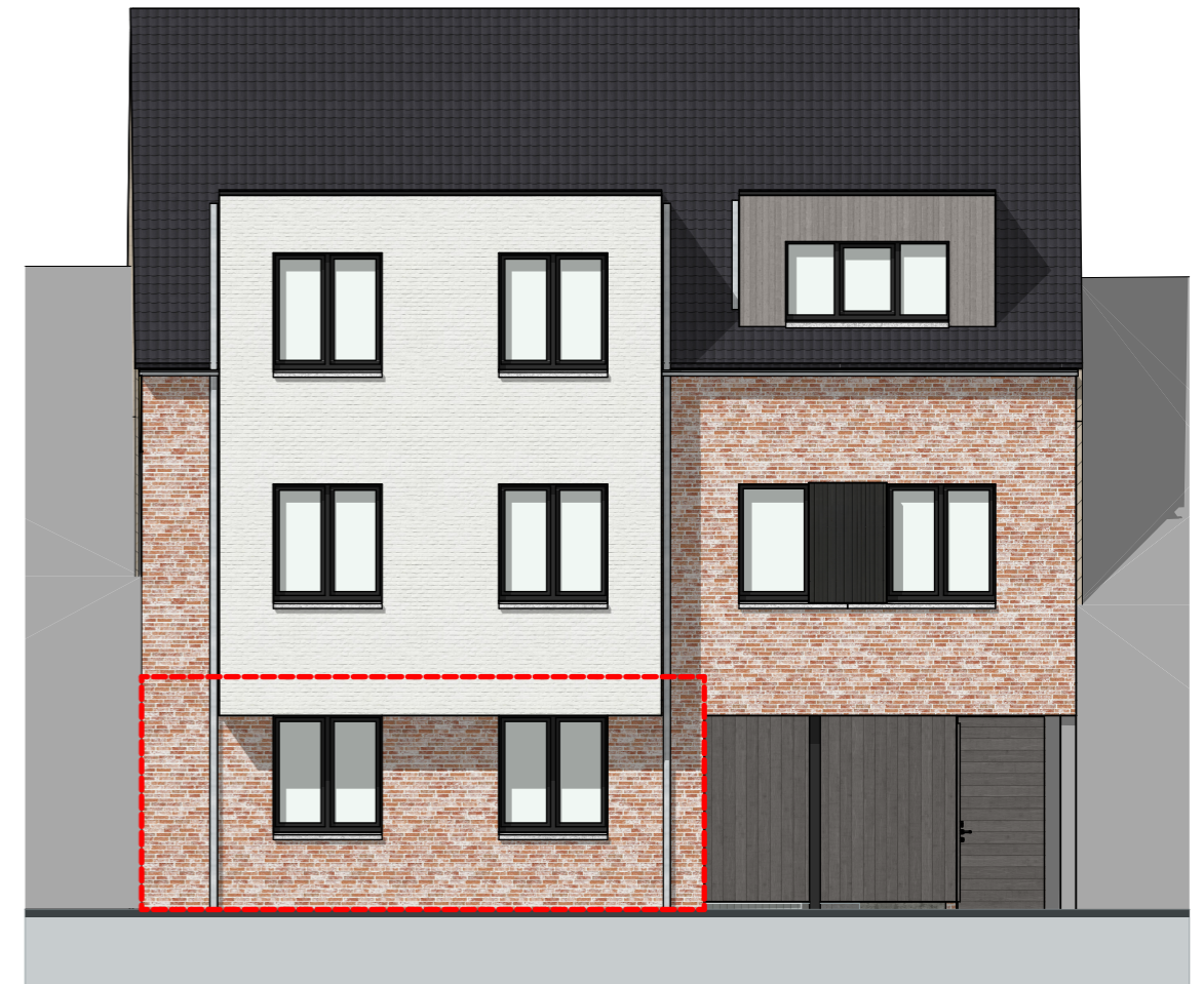
Voorgevel - 1:100

LEGENDE VERKOOPPLAN Het verkoopplan is geen contractueel document. Vermelde afmetingen, oppervlaktes, meubilair en toestellen zijn dus uitsluitend illustratief. Alle maten en oppervlaktes zijn richtinggevend en kunnen wijzigen na definitieve opmerkingen. De beschrijvingen in het lastenboek hebben voorrang op het verkoopplan. Noodzakelijke aanpassingen om technische, constructieve en/of architectonische redenen zijn steeds mogelijk. De plannen mogen niet gekopieerd worden en blijven het intellectuele eigendom van de ontwerper.