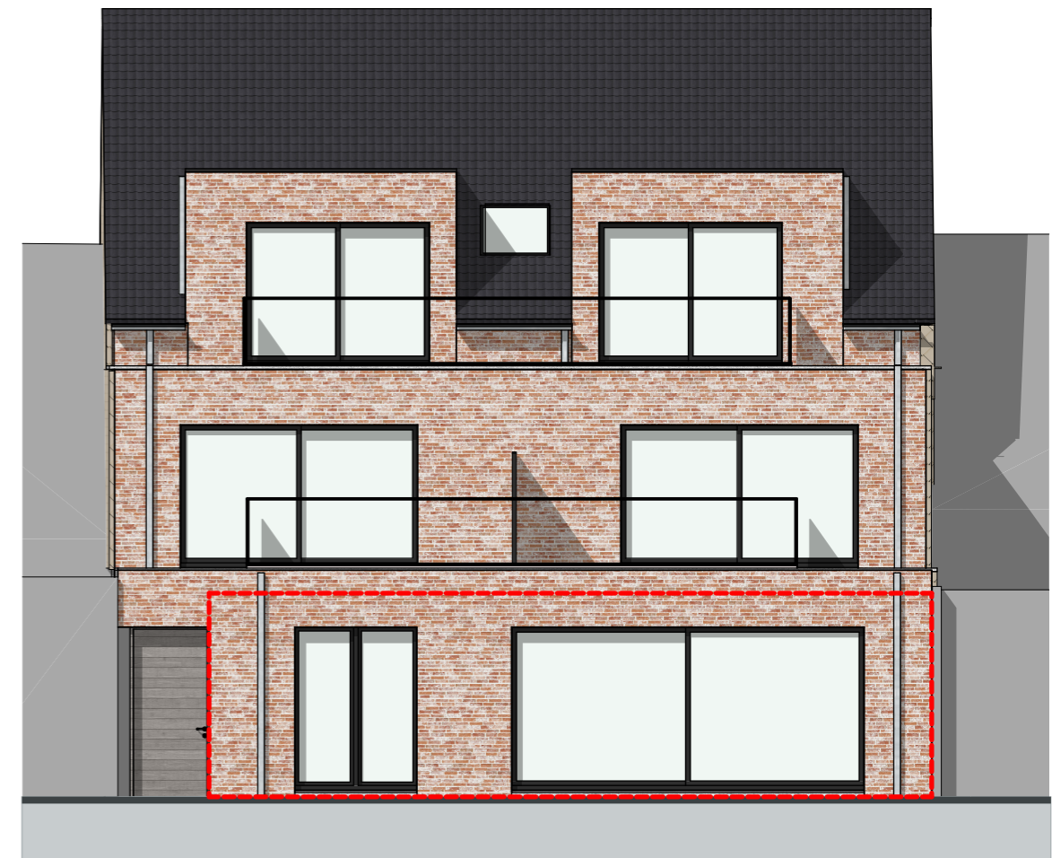
Achtergevel - 1:100